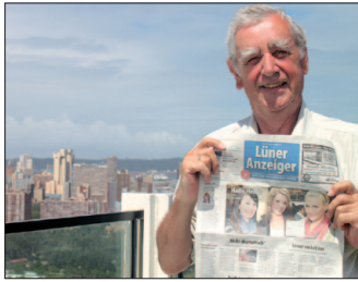
Helmut Schmidt vor der Skyline von Durban.

Sonntag bestreitet die deutsche Fußball-Nationalmannschaft ihr erstes Spiel bei der WM in Südafrika. In Durban. „Im schönsten Stadion der Welt“, wie Helmut Schmidt findet.